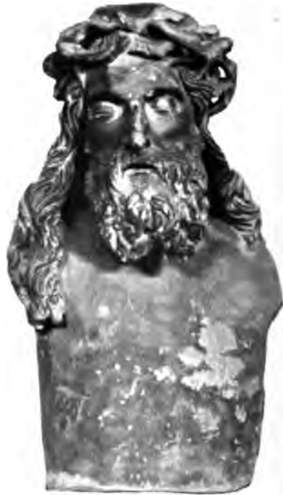
Le Christ de Claus Sluter.

Le naturalisme de sa sculpture fut encore accru par des emprunts faits à l'orfèvrerie et à la peinture. Jérémie reçut une paire de lunettes fabriquée par un habile orfèvre, Hannequin de Hacht. Jean Mælweel, un grand peintre qui fut au service d'Isabeau de Bavière, couvrit le piédestal et les statues de dorures et de couleurs qui sont aujourd'hui effacées, mais dont un Rapport, rédigé en 1832, permet de se rendre compte. Les fonds des niches étaient d'une teinte noirâtre destinée à faire ressortir davantage les figures ; les filets saillants et les moulures creuses de la corniche étaient dorés, et les parements de la pile peints aux armoiries du duc de Bourgogne entourées de tourbillons de flammes. Moïse avait une tunique rouge et un manteau « d'or doublé d'azur » ; David, un manteau de drap d'or doublé d'hermine et une tunique « étoilée d'or, coupée de larges bandes transversales entièrement ouvragées